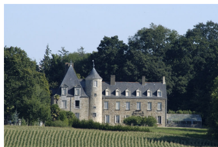
Château de Saint-Aubin

Cette randonnée découverte d'une quinzaine de km à allure tranquille est proposée aux familles, en particulier aux nouveaux arrivants désireux de découvrir leur nouvel environnement. Elle est gratuite . Les personnes désireuses de ne faire que la moitié du parcours ou participer seulement au pique-nique pourront se joindre aux randonneurs.